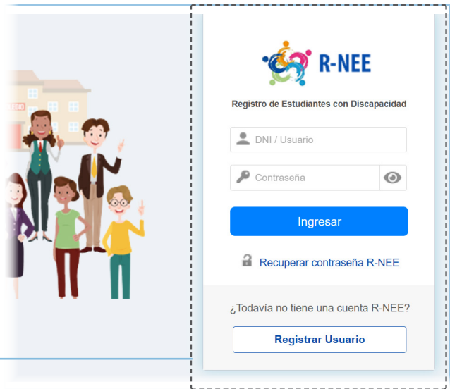
Pantalla de acceso al sistema de registro.

Es responsabilidad del director de la IE completar esta información o designar a un encargado para esta tarea.